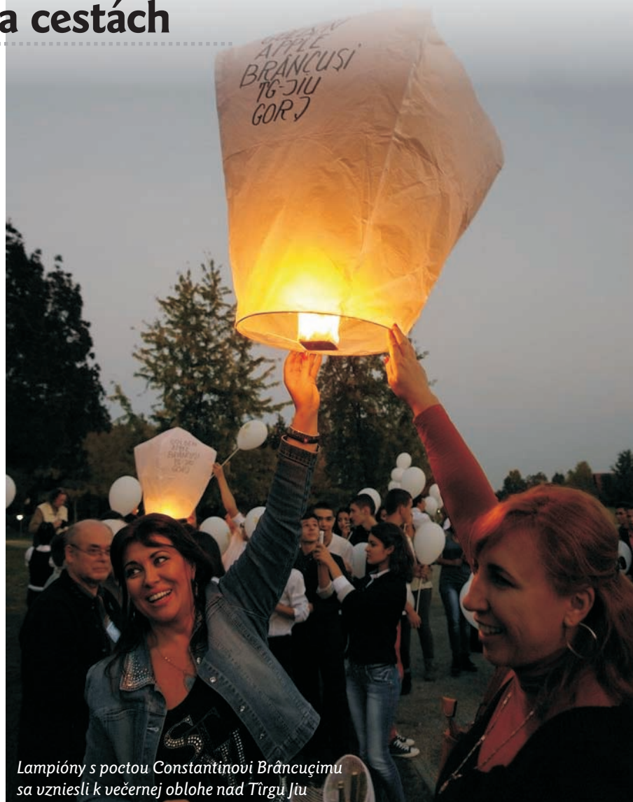
Lampióny s poetou Constantínovi Brâncușimu sa vzniesli k večernej oblohe nad Tîrgu Jiu