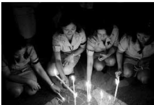
Journalists in the Philippines honour the 31 colleagues lost in the massacre of journalists on November 23rd