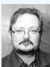
Predseda Ján Füle – do 16. novem- bra 2001